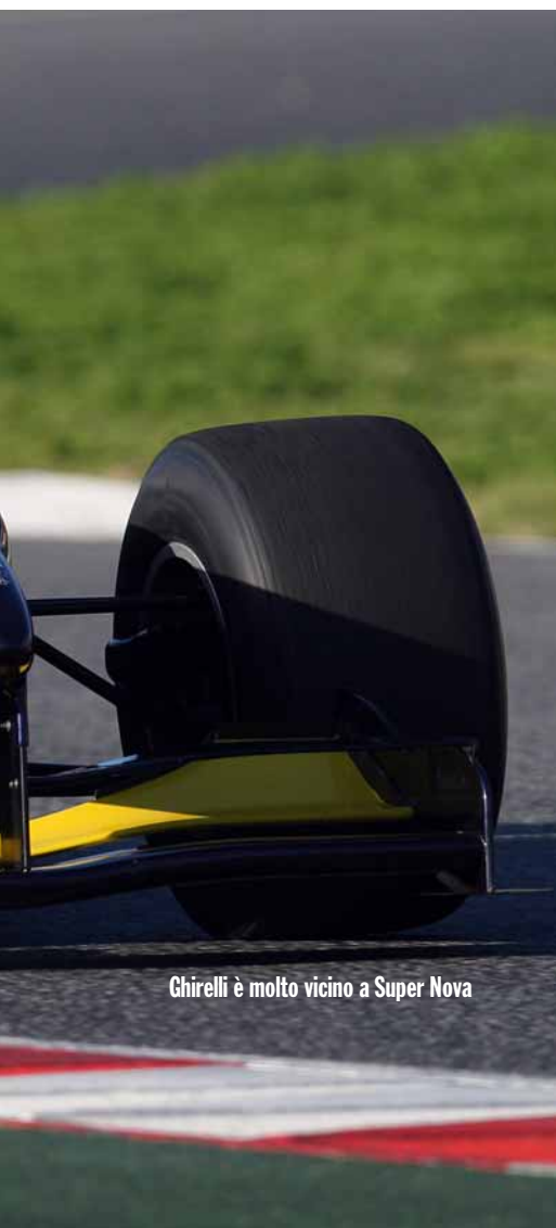
Chirelli è molto vicino a Super Nova