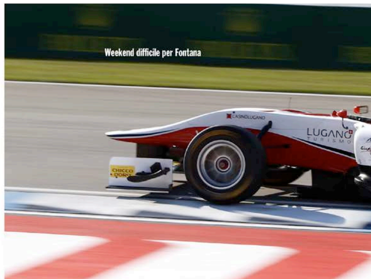
Weekend difficile per Fontana